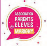
Association des Parents d'Elèves de Marigny