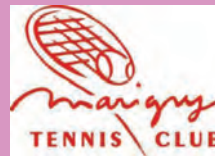
Marigny Tennis Club