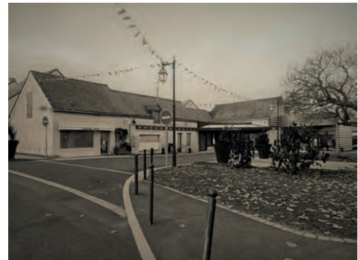
Centre-bourg de Marigny les Usages à différentes époques