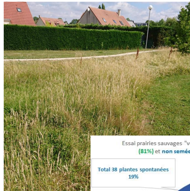
Essai prairies sauvages "végétal local" : évaluation moyenne des espèces semées (81%) et non semées (19%) = Résultats des 4 séries de relevés 2023