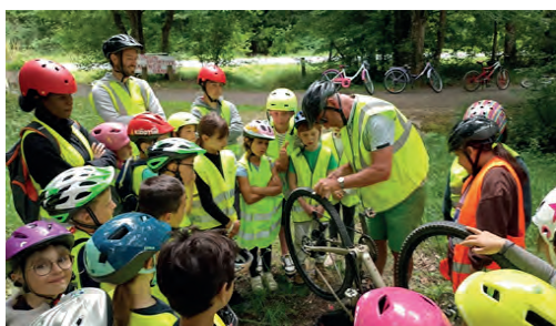
petite crevaision sur le parcours vélo

Des moments de rédaction de messages d'encouragements aux athlètes qui concourent aux J.O. et J.O.P. sont également au programme.