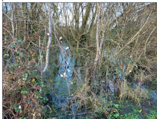
Mare du Grand Moulin avant travaux