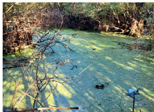
Mare du Grand Moulin après travaux